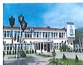
ООО «РН-Туапсинский НПЗ»